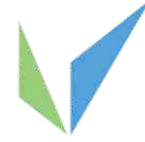
مدينة الملك عبدالعزيز للعلوم والتقنية KACST